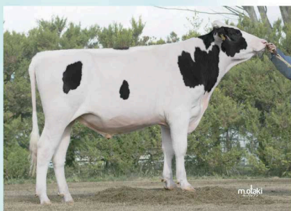
本牛：ローヤル スーパー スプレンダー

ローヤル シルバ - ET | シーガルベ イシルバ - ET | ローヤル ジエラード リンディ