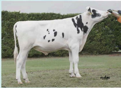
本牛：1K ジヤマルコ クラシック ET

3-7 UPD ケンガス 11800 ET | パツツヒル シルバ - ケンガス ET | コーポ ホットショット 6895 8395 ET