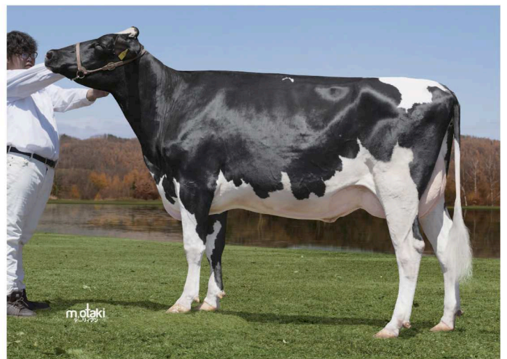
フォレスト ミツキーランド プレジデント GP-80 乳器 -79 別海町 (株) フォレストファーム 所有 母の父 : ストレチア ミラクル ジャスティス ET