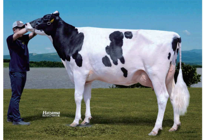
アイコール ハウル マリナー GP-81 乳器 -81 (2才) 訓子府町 竹本 竜也氏 所有 母の父 : ニューバース ブラック ウィンテス コリア ET