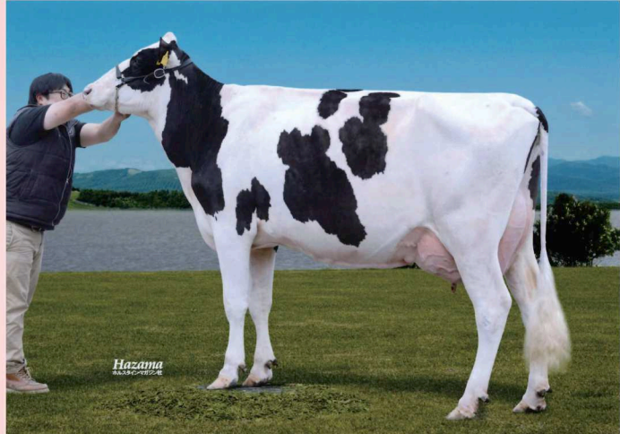
フアーロック ハウル リコ (2産) GP-80 乳器 -81 (2才) 別海町 戸田 好則氏 所有 母の父 : ライブストック モンブラン