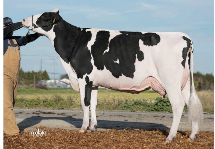
ライズランド パラマウント パリス GP-80 乳器 -80 (2才) 標茶町 池田 光章氏 所有 母の父: デルタ パラマウント