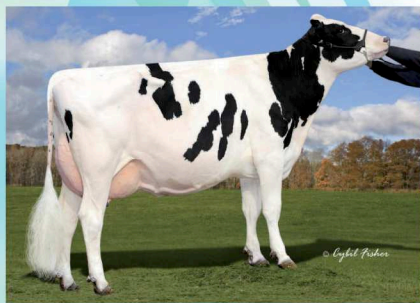
曾祖母:ハイアランソム モーグル コーゴー ET

Milk +1,344 kg 決定得点 +0.54 Fat +64 kg +0.15% 体貌と骨格 +0.58 SNF +120 kg +0.18% 肢蹄 +0.06 Pro +61 kg +0.14% 乳用強健性 +0.40 (54%R) 乳器 +0.54 体細胞スコア 2.01 (48%R) 娘牛受胎率 48% (43%R) 気質 101 空胎日数 133日 (53%R) 搾乳性 99 泌乳持続性 -0.28 (21%R) 在群能力 103 (30%R) 暑熱耐性 -0.62 (19%R)