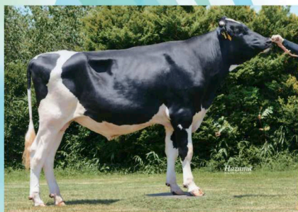
本牛:ハツピークロス ファイン ET

Milk +884 kg 決定得点 +0.90 Fat +72 kg +0.37% 体貌と骨格 +0.45 SNF +96 kg +0.21% 肢蹄 +0.11 Pro +51 kg +0.21% 乳用強健性 +0.36 (54%R) 乳器 +1.17 体細胞スコア 2.27 (48%R) 娘牛受胎率 42% (40%R) 気質 99 空胎日数 146日 (51%R) 搾乳性 101 泌乳持続性 +0.69 (21%R) 在群能力 101 (30%R) 暑熱耐性 -0.04 (19%R)