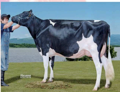
ミツクラン ロードビュー ビュー GP-81 乳器-82 (2オ) 広尾町 ミツクランデーリィー 所有 母の父: エントレス ジアンビ