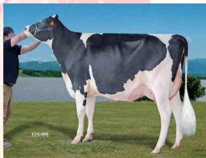
アーチス デスアーク ジーン GP-81 乳器-82 (2オ) 豊頃町 按田牧場 所有 母の父: スプリングヒルオー ティー ラウンドアップ*