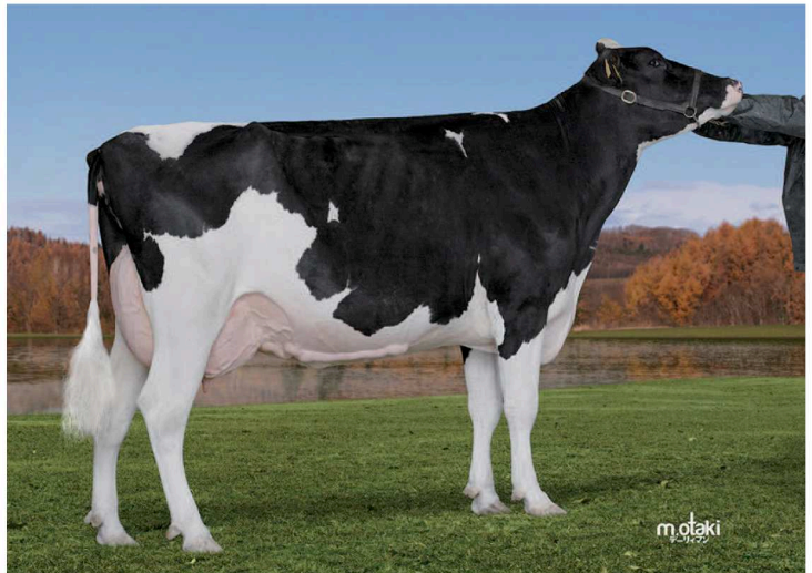
ヒンペル サファイア トラデイション (2産) GP-81 乳器 -80 (2才) 愛知県田原市 (有) 鈴木牧場 所有 母の父 : ファーニアー TBR アルタアパロン ET