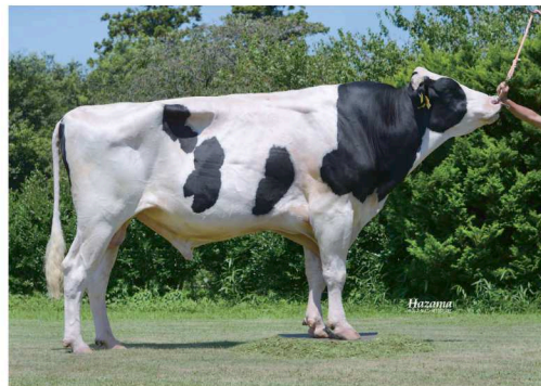
生産者：安平町 竹田 譲治 氏

CDF BLF CVF BYF A1/A2 57516 個体識別番号 1446611225