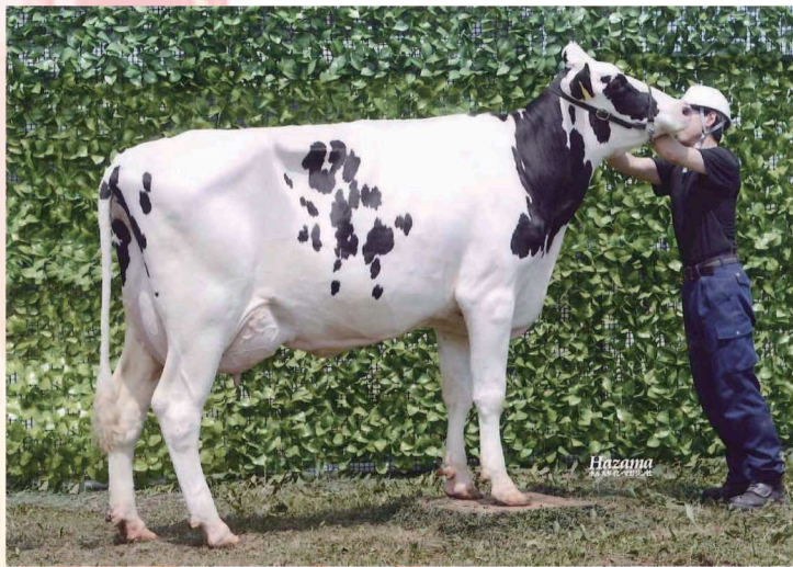
RE タムレ マセル マウイ ET (NLBC マリッツトムバツクの全姉)