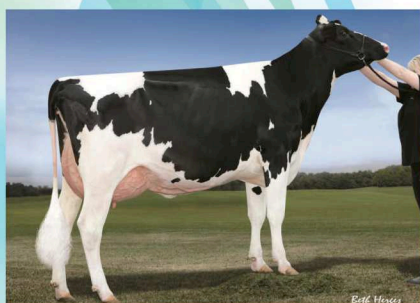
4代祖:ラークレスト カル ET