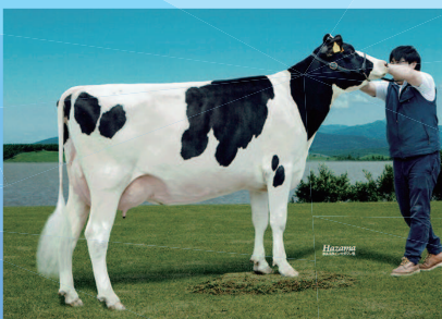
ダビドソンマツセイ マーシャル マキシム GP-81 乳器-82 (2才) 別海町 松木牧場 所有 母の父: レガント BE ラッパ デニス ET

Milk +511 kg 決定得点 +0.64 Fat +48 kg +0.28% 体貌と骨格 +0.60 SNF +100 kg +0.48% 肢蹄 +0.34 Pro +52 kg +0.36% 乳用強健性 +0.69 ( 88%R 43 D/35 H ) 乳器 +0.54 体細胞スコア 2.10 ( 78%R 38 D/32 H )