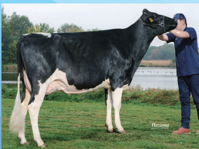
エマーソン デロリアン ジェイ GP-82 乳器-82 (2才) 新得町 (農) 三友農場 所有 母の父: ワーテル エマーソン ジェイ ET

Milk +647 kg 決定得点 +0.41 Fat +38 kg +0.14% 体貌と骨格 +0.07 SNF +83 kg +0.27% 肢蹄 +0.65 Pro +38 kg +0.18% 乳用強健性 -0.09 ( 89%R 53 D/42 H ) 乳器 +0.55 体細胞スコア 1.81 ( 80%R 46 D/35 H )