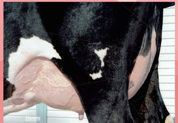
グリーンヒル ノクターン ガール GP-82 乳器-82 (2才) 芽室町 鈴木牧場 所有 母の父：JZM ゴールデンボーイ ET