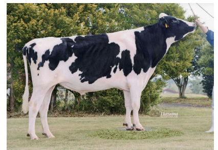
生産者：浜中町 菊地 光男氏