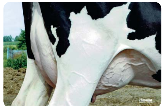
娘 バリエント デニソン ファルシオン 北海道鹿追町 (株)國枝牧場 所有 母の父: ジャーランド デニソン ET