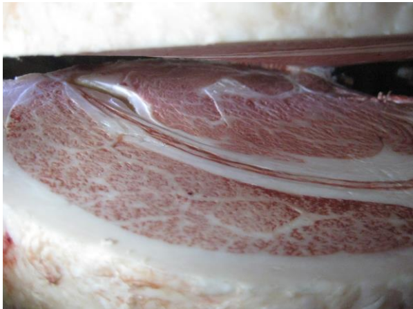
岩手県畜産共進会 最優秀賞 美津百合×安福久×平茂勝