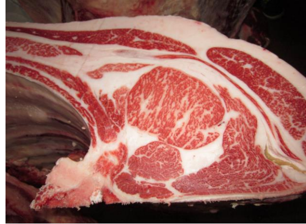
北海道枝肉共励会 最優秀賞 美津安照×ホルスタイン FCMaxライン