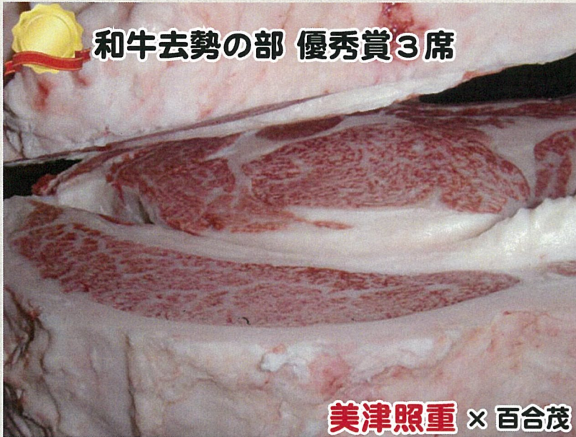
和牛去勢の部 優秀賞3席