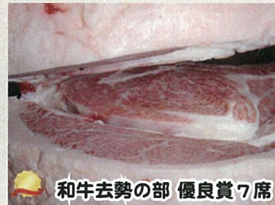
和牛去勢の部 優良賞7席

父：美津照重 母の父：勝忠平 性別：去勢 枝肉重量： 575 kg ロース芯： 110 cm 2 バラ厚： 9.4 cm BMSNo.1 2 格付：A 5