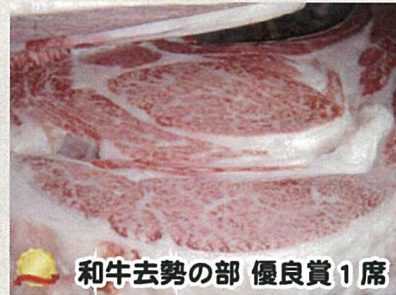
和牛去勢の部 優良賞1席

性別：去勢 枝肉重量：617 kg ロース芯：98 cm 2 バラ厚：9.7 cm BMSNo.1 2 格付：A 5