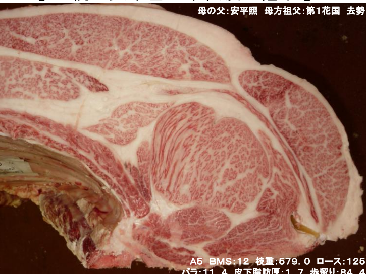
母の父:安平照 母方祖父:第1花国 去勢