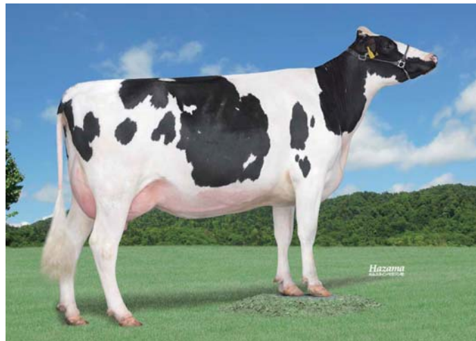
娘 ダイヤモンド ジェツド D4 コーダイ 母の父:レーガンクレスト ダンディー ET