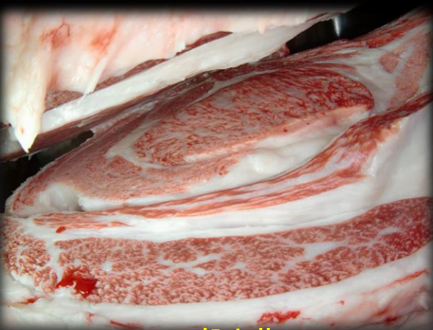
H27.7.10 一般出荷 茂晴花×菊福秀×安福165の9 雌 BMS11 枝肉重量:429kg ロース芯:68cm 3 パラ厚さ:8.0cm