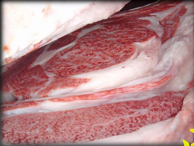
H27.4.17 丸二産業(有)枝肉研究会 優良賞 茂晴花×福栄×北国7の8 去勢 BMS10 枝肉重量:553kg ロース芯:71cm 3 パラ厚さ:8.3cm