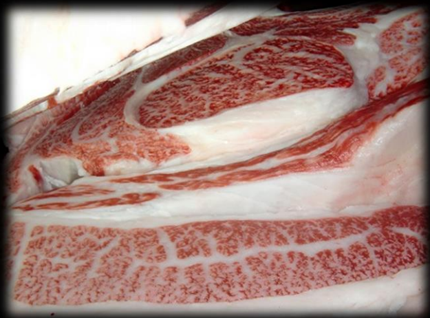
H29.3.1開催 第44回 茨城常陸牛枝肉共励会 茂晴花×幸福栄 去勢 BMS8 枝肉重量:603kg ロース芯:69cm 3 パラ厚さ:9.1cm